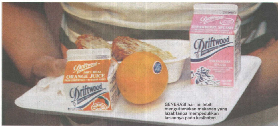
GENERASI hari ini lebih mengutamakan makanan yang lazat tanpa mepedulikan kesannya pada kesihatan.

Adakah protein daripada haiwan baik untuk kesihatan dalam jangka masa panjang?