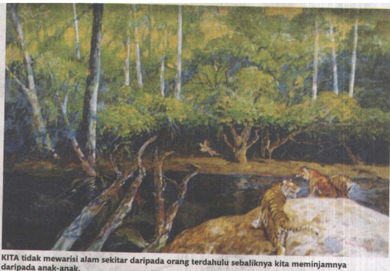
KITA tidak mewarisi alam sekitar daripada orang terdahulu sebaliknya kita meminjamnya daripada anak-anak.