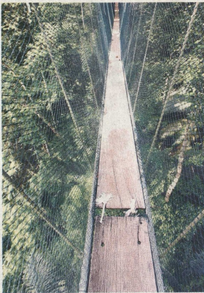
■甲洞森林研究局吊桥全长150公尺，距离地面50公尺，安全措施充足。