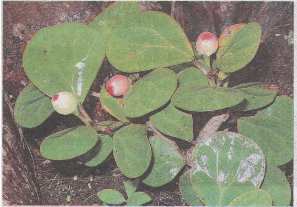
● Mas cotek jenis Ficus deltoideae antara yang digunakan dalam penghasilan ISOmedic.

Dapatkan berita terkini & berita edisi secara online www.sinarharian.com.my