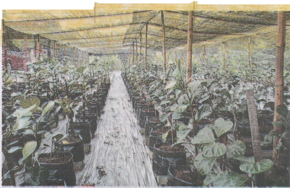
● Penanaman Mas Cotek.

Language Malay Page No L-S32 Article Size 718 cm 2 Color Full Color ADValue 3,949 PRValue 11,847