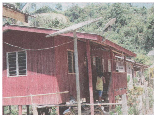
● Antena televisyen berbayar dapat dilihat di kawasan Orang Asli.