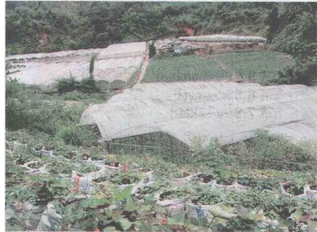
● Hampir kesemua kawasan Lojing mempunyai pemandangan sebegini.

Kecil Dewan Undangan Negeri (DUN) Galas hari ini, diharap dapat memperbaiki kehidupan Orang Asli kepada satu tahap yang lebih baik.