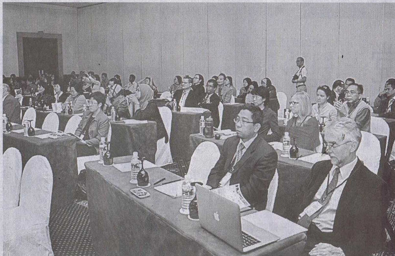
■主宾们与讲师合影。

(本报古晋8日讯)在气候转变的课题上，发展中的国家，如马来西亚不应在迈向发展目标时受到指责，先进国应该专注在真正的课题上，并非以经济及官僚约束作为无法实践目标及承诺的藉口。