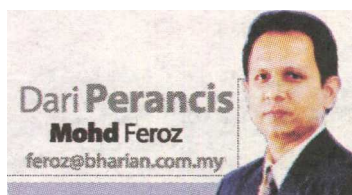
(Yang mengikuti kunjungan ke Paris, tajaan Kedutaan Perancis)

W ALAU PUN lebih terkenal kerana teknologi tinggi seperti kereta api laju TGV, Perancis sebenarnya juga maju dalam bidang pertanian seperti sains pertanian atau kejuruteraan pertanian.