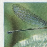
容易勾起小时候回忆的蜻蜓照。