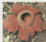
勒察莱佛士花，从原野中发掘生命哲学。