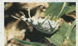
四脚朝天，装死的虫。