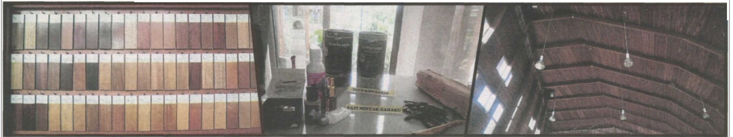
CONTOH kayu komersial terdapat di Malaysia ini dipamerkan.