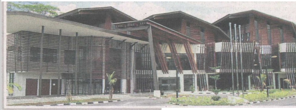
GALERI Glulam dibina di kawasan seluas 1.9 hektar.