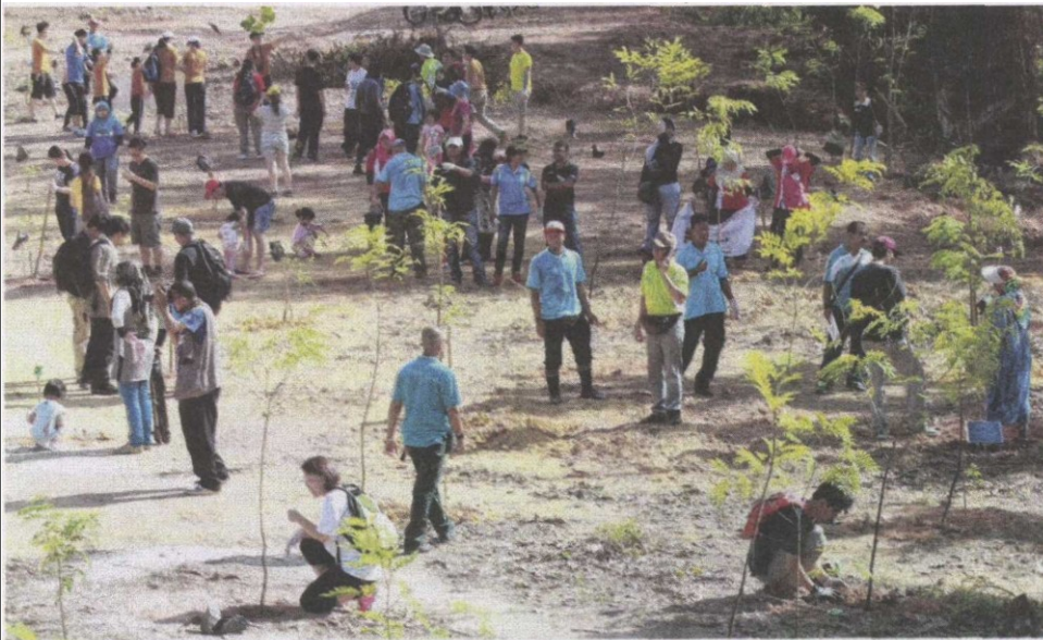
AKTIVITI menanam pokok antara program sambutan Hari Hutan Antarabangsa di FRIM Kepong baru-baru ini.