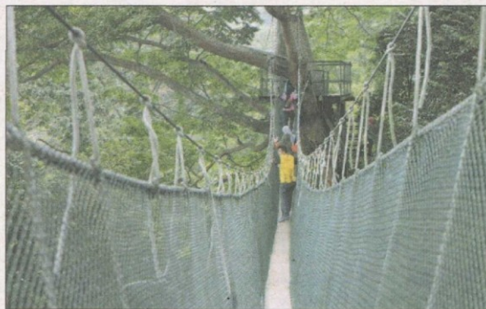
这条设在研究院内的吊桥，能让民众在树木之间「穿梭」，体验大自然的气息。