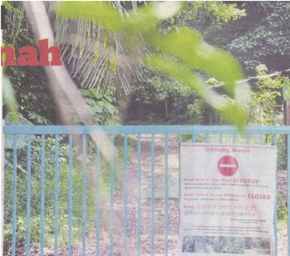
DENAI Rover sejauh hampir empat kilometer ditutup sementara untuk kerja baik pulih.