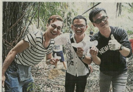
▲参与者在主办单位发放的许愿卡上,写下祝福及心愿,再与树苗一同种下。