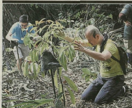
▲参与者种下树苗,为生态环境添一分绿意。