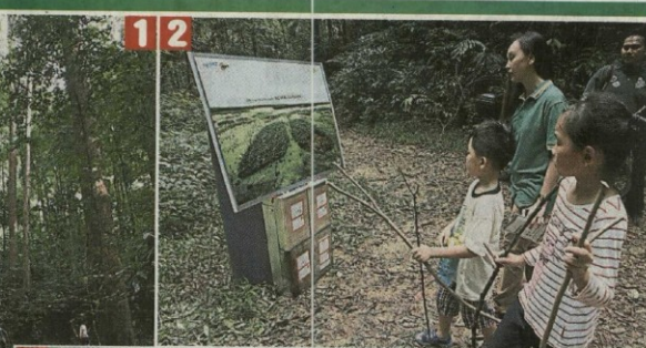
1.种树活动参与者在主办单位的安排下,徒步进入山林,除了种树之外,也亲身体验大自然生态。