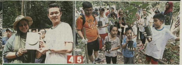
3.所有参与者在完成种树活动后,与主办单位合影。