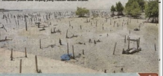
KEADAMAN polak akar tunggang yang tumbuh di hutan mangrove.