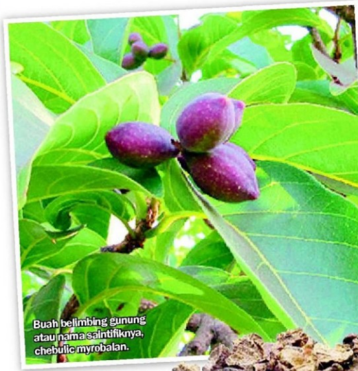
Buah belimbing gunung atau nama saintifiknya, chebolic myrobalan .

Amirul Syafiq berkata, dengan bermodalkan RM2,000, mereka pada mulanya menjual buah tersebut secara run-cit di beberapa lokasi terpilih.