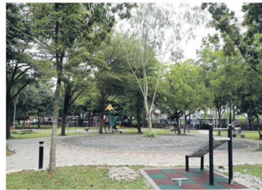
Pemandangan Taman Mini Ajaib sebelum ia berubah wajah.

"Antara pokok dan spesies tumbuhan yang digunakan termasuklah pokok renek berbunga yang merangkumi bunga kertas, amazon blue , petunia , ros jepun, reulia dan