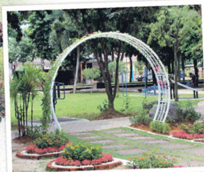
Pelbagai struktur peragaan menjadikan Taman Mini Ajaib pilihan orang ramai untuk bersantai mahupun merakamkan gambar.