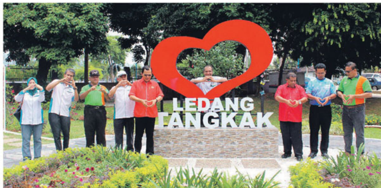
Replika 'Love Ledang Tangkak' menyerikan lagi persekitaran Taman Mini Ajaib.

"Malah pihak Frim turut diminta menyediakan anggaran