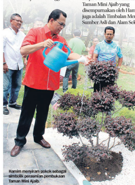
Hamim menyiram pokok sebagai simbolik perasmian pembukaan Taman Mini Ajaib.