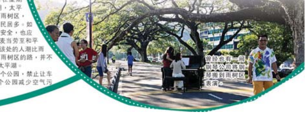
曾经也有一间阿越公司曾经移动到雨林区表演。

雨树生病承包商施救 由于太平湖雨树树龄都非常高，太平市议会多次安排植物专家为雨树探病。早前大马森林研究局官员为太平湖雨树探测“健康状况”，检验结果一般雨树健康良好，有健康问题的雨树则由承包商去施救。 当时，大马森林研究局官员是采用先进科技Picus Sonic Tomograph探测雨树的健康，先用带圈起雨树树身，再装上敏感器，然后接电线至手提电脑，约1小时15分钟时间即可确定雨树的健康状况。通常树身越大，需要的时间越长，如果树身较瘦，则不需要那样久的时间。 官员说，一棵雨树的树皮，并不能看出雨树是否健康，须作内部探测才标准。如果树身内有洞、裂或腐烂，意味雨树内部生病，必须对症下药解决。