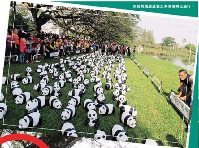
以前熊猫展览在太平湖雨林区进行。