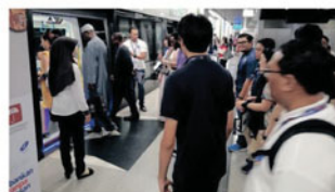
Sesi lawatan di sekitar Kuala Lumpur Sentral dan perkongsian pengalaman menaiki MRT bersama tuan rumah, Suruhanjaya Pengangkutan Awam Darat.

Pembangunan semula bandar di kawasan yang kurang digunakan atau tidak lagi berfungsi dengan dihidupkan semula melalui pelbagai aktiviti melibatkan komuniti tempatan. Pembangunan semula bandar telah diiktiraf sebagai salah satu mekanisme perancangan bandar di Malaysia terutamanya di projek perumahan terbengkalai atau kawasan komersial lama yang tidak berdaya saing. Kawasan lawatan ialah Sentul Timur & Barat (YTL), Bukit Bintang City Centre (UDA) dan KL Sentral (SPAD).