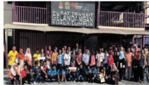
Aktiviti bersama Penghuni Pusat Gelangpang.

Pertumbuhan sektor perumahan Malaysia disokong oleh tiga faktor, antaranya penduduk yang semakin meningkat, kadar pembandaran yang tinggi dan ekonomi yang melonjak naik. Di Malaysia, dasar perumahan telah berkembang sejak beberapa tahun lalu menerusi pelbagai rancangan pembangunan negara. Permintaan untuk perumahan di Malaysia telah meningkat berikutan pertumbuhan ekonomi yang sihat. Kawasan lawatan ialah Kuala Lumpur Homeless Transit Centre (KWP), Residensi Kerinchi (Persatuan Penduduk, KWP) dan PPR Seri Alam (DBKL & JPN).