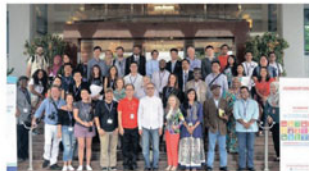
Sesi bergambar, taklimat dan penyampaian cenderamata kepada tuan rumah lawatan ke Sunway City.

Laluan 2 : Urban Solution & Innovation Bandar-bandar di Malaysia semakin menghadapi dalam usaha menambah baik kualiti kehidupan bandar. Beberapa inovasi bandar telah dilaksanakan telah mengubah kehidupan berjuta-juta penduduk dengan penambahbaikan sistem pengangkutan, kumbahan, rumah kediaman dan juga tempat kerja baru. Kawasan lawatan ialah Bandar Sunway (Sunway Group), Pantai 2 STP (IWK) dan 'River of Life' (DBKL).