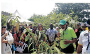
Taklimat di PPR Raya Permai bagi sesi lawatan Urban Farming.

Malaysia telah mengambil langkah-langkah proaktif dengan membina prasarana yang kukuh untuk usahawan tempatan dalam landskap global. Usahawan juga perlu kreatif dan inovatif agar mereka mampu menempatkan diri dalam pasaran yang kompetitif. Satu ekosistem keusahawanan yang mantap dan mampan harus dibangunkan agar ia menjadi pemacu ekonomi negara untuk terus berdaya saing. Kawasan lawatan ialah Youth Café, Sentul (Project B), Urban Farming, Taman Herba Sg. Midah PPR Raya Permai Tambahan (DBKL & Persatuan Penduduk) dan Medan Pasar & Urban Village (Think City).