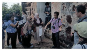
Aktiviti 'walkabout' di kawasan warisan.

Warisan bersejarah bandar-bandar di Malaysia kini berhadapan dengan masalah akibat pertumbuhan penduduk dan pembangunan ekonomi yang pesat. Pembangunan perbandaran baru dengan reka bentuk moden dan ketidakseragaman sosio budaya di pinggir bandar-bandar bersejarah turut memberi tekanan serta mengganggu identiti bandar warisan. Oleh itu, inisiatif pembangunan semula perlu diperkenalkan untuk mengembalikan kegemilangan selain memperbaiki gaya