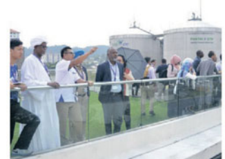
Delegasi melawat sendiri kemudahan yang disediakan