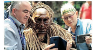
Lawatan ke Mah Meri Cultural Village di Pulau Carey.

Perbandaran mempunyai kesan yang ketara ke atas kawasan luar bandar, terutamanya sumber bekalan makanan dan juga sumber-sumber asli yang lain. Di seluruh dunia, kita menyaksikan peningkatan dalam pengeluaran sumber bekalan makanan seperti buah-buahan, sayur-sayuran dan tenusu, untuk memenuhi permintaan di bandar. Kawasan luar bandar ini dihubungi oleh rangkaian pengangkutan, sistem komunikasi, kemudahan elektrik dan mempunyai rangkaian peniaga tempatan. Kawasan lawatan ialah Pulau Carey (JKOA).