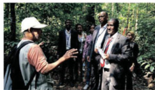
Taklimat dan aktiviti di FRIM Trails, Botanic Gallery dan Crown Shyness.

Malaysia mempunyai visi untuk mencapai status 'Taman Negara' menjelang 2020, dan sejajar dengan itu, kita perlu mencari jalan untuk memastikan pembangunan seimbang dan integriti ekologi dipelihara. Elemen kehijauan bandar dalam pembangunan negara perlu diberi penekanan supaya pembangunan fizikal dan kualiti hidup dapat discimbangkan. Kawasan lawatan ialah Forest Research Institute Malaysia (FRIM) dan Perdana Botanical Garden (DBKL).