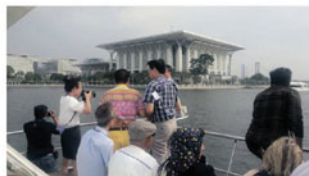
River cruise di Putrajaya.

Laluan 3 : Urban Development Flagship Urbanisasi hari ini menawarkan akses kepada cara hidup baru, peluang baru, dan penyelesaian berdaya maju kepada keperluan populasi dan persekitaran yang semakin meningkat. Ia juga satu percubaan berani, menawarkan model terkehadapan untuk mewujudkan tempat yang lebih pintar untuk tinggal, bekerja dan bermain. Kawasan lawatan ialah Putrajaya dan Cyberjaya.