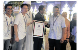
Antara aktiviti sepanjang lawatan

Urbanisasi hari ini menawarkan akses kepada cara hidup baru, peluang baru, dan penyelesaian berdaya maju kepada keperluan populasi dan persekitaran yang semakin meningkat