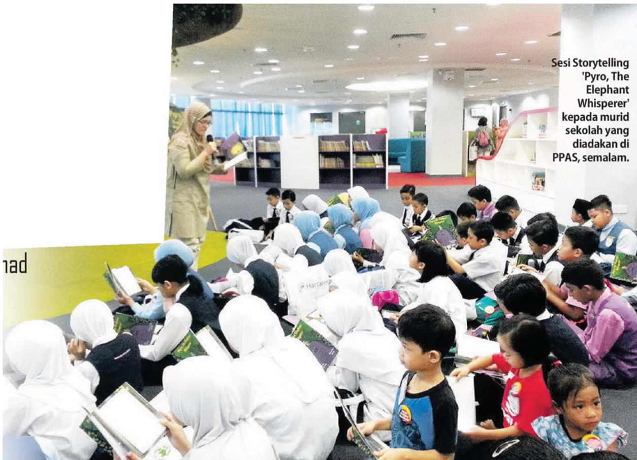
Sesi Storytelling 'Pyro, The Elephant Whisperer' kepada murid sekolah yang diadakan di PPAS, semalam.