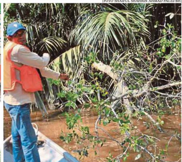
Pokok berembang ditebang pihak tidak bertanggungjawab.